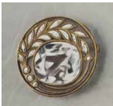
Иллюстрация 4. Рисунок броши Б-85. Из альбома «Русские самоцветы» [13, 76]

женина и предмет позволяет говорить о существующей в производстве в период творчества использования методов. Так, в отличие от описания приведенной в альбоме броши совмещены изогнутого горного хрусталя, предмет из собрания музея включает более изысканные драгоценные огненные демтоиды нежно-зеленого оттенка, дополненные в качестве яркого контраста ярким синтетическим корундом.