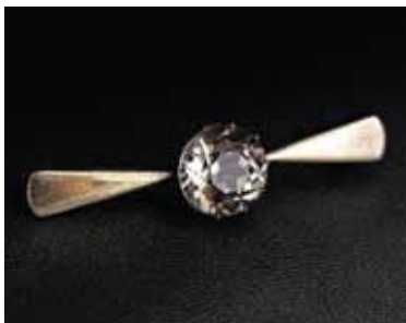
Иллюстрация 2. Брошь. 1958 г. Свердловский завод «Русские самоцветы». Серебро, дымчатый кварц, огранка, крепка. (Шифр Б-27). Частная коллекция