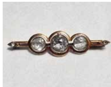
Иллюстрация 3. Брошь. 1958 г. Свердловский завод «Русские самоцветы». Серебро, горный хрусталь, золочение, огранка, крепка. (Шифр Б-68). Частная коллекция