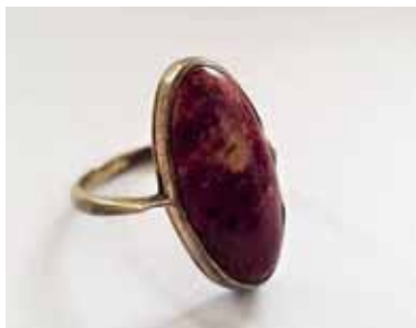
Иллюстрация 1. Кольцо. 1953 г. Свердловский завод «Русские самоцветы». Серебро, яшма, золочение, огранка, крепка. (Шифр К-3). Частная коллекция