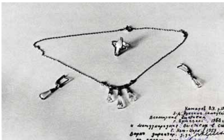
Иллюстрация 6. Фотография рунтур В.У. Комров. 1958 г. Музей истории к мнерезного и ювелирного искусств.

[10, 47]. Тем не менее И.М. Шкинко и В.Б. Семенов указывают, что вместе с к мнерезными предметами были представлены и ювелирные изделия из золота, и приводят цитату из диплома «...3 ювелирные изделия и л рцы из м л хит» (без указания источника) [16, 224].